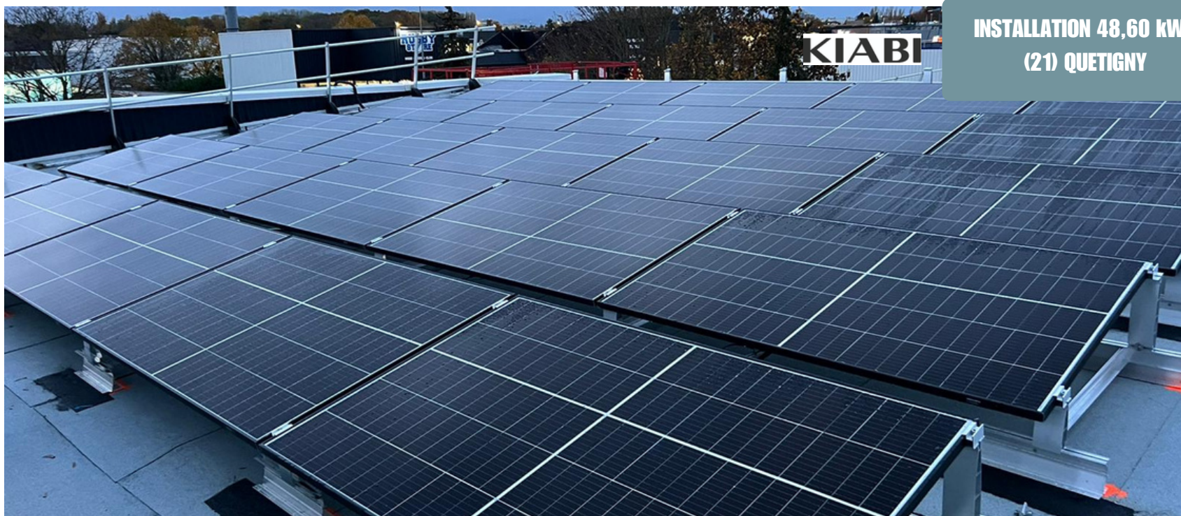
INSTALLATION 48,60 kWc (21) QUETIGNY