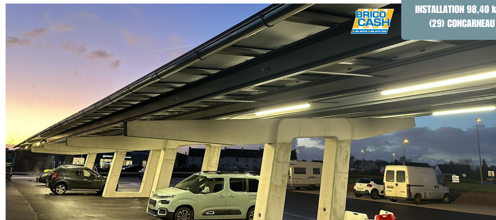
INSTALLATION 98,40 kWc (29) CONCARNEAU